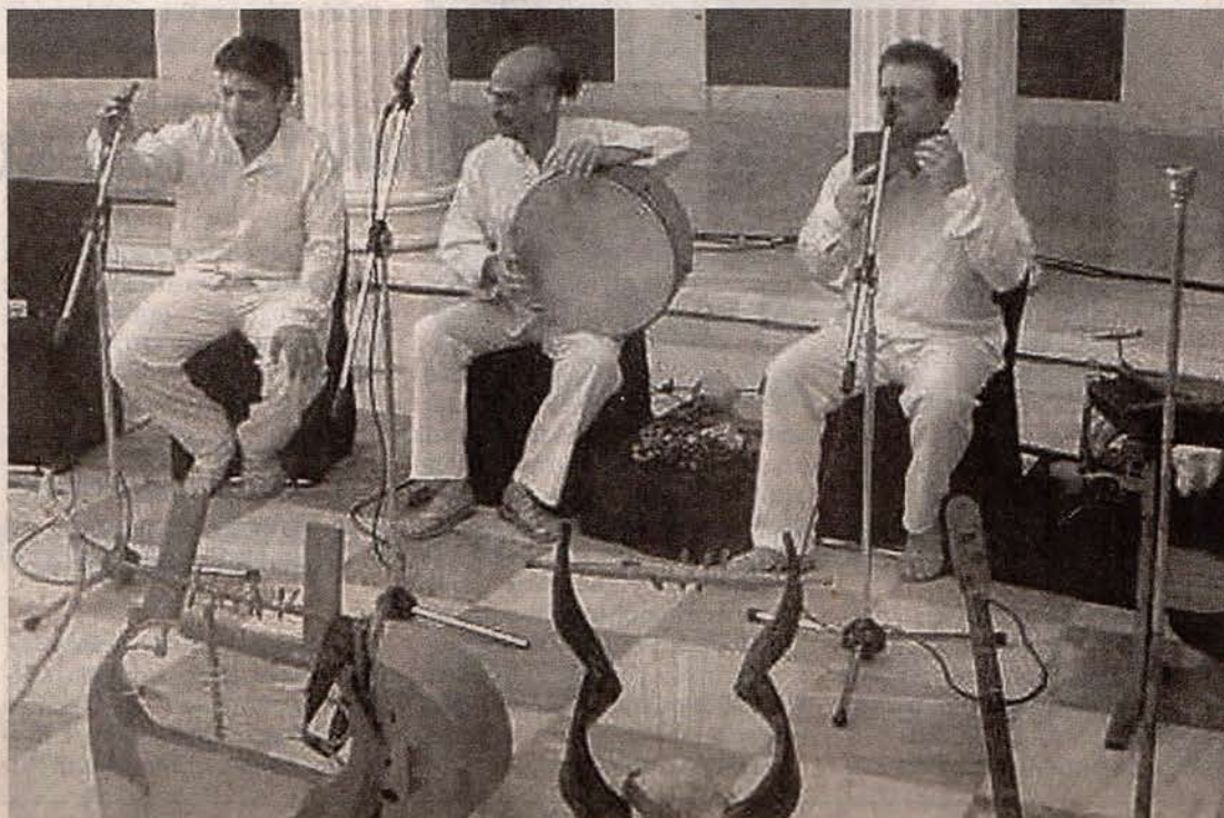
Μερικά από τα μέλη του «Λύραυλου» σε παλαιότερη συναυλία. Μπροστά, ανακατασκευασμένα όργανα της ελληνικής αρχαιότητας που χρησιμοποιήθηκαν κατά την εκδήλωση.

Ο πρόεδρος του Νισυριακού Συλλόγου, Γεώργιος Ανδριώτης, δήλωσε ότι για τον ίδιο πρωταρχικό ενδιαφέρον έχει η αναβάθμιση και προβολή ποιοτικών εκδηλώσεων «από την παραμελημένα, αλλά ένδοξη ελληνική ιστορία, που την προβάλλουμε μόνο καιροσκοπικά». Για τη συναυλία τόνισε ότι «πρέπει να γίνει η απαρχή για άνοιγμα ενδιαφερόντων σε άλλα επίπεδα». «Η Ομογένεια και ιδιαίτερα η Αστόρια, είναι πάντα το παραμελη-